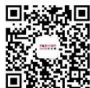
时尚展微信公众号